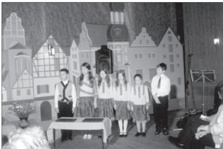
Pagasta bērnu dziesmotais sveiciens